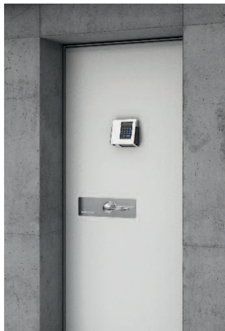
Ansicht Schutzraumtüre aussen