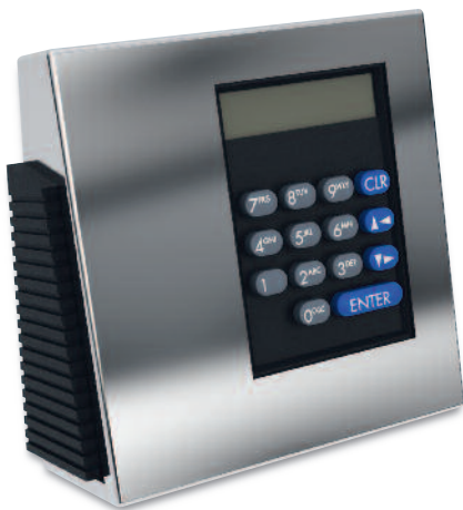
Paxos Advance mit Tastatur und verchromter Tastaturabdeckung