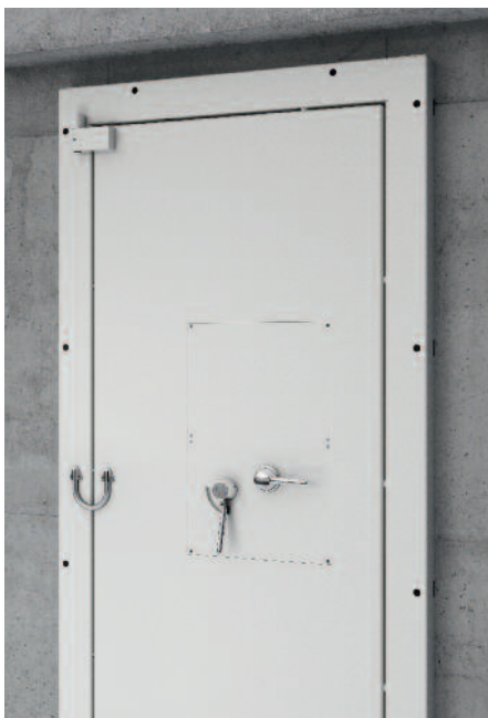
SRT Standard innen angeschlagen mit Notöffnung