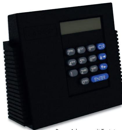
Paxos Advance mit Tastatur